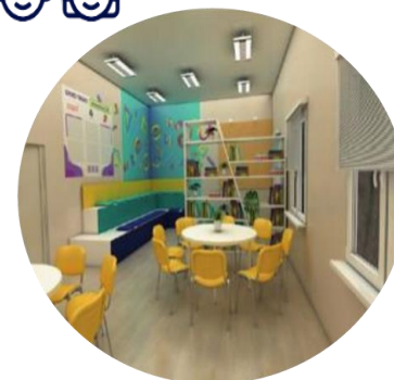
ЦЕНТРЫ ДЕТСКИХ ИНИЦИАТИВ